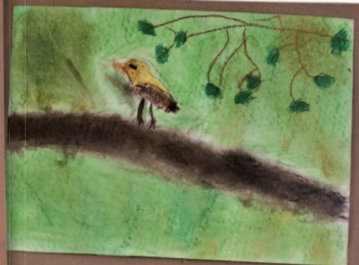
Agáta Kremplová 5 let