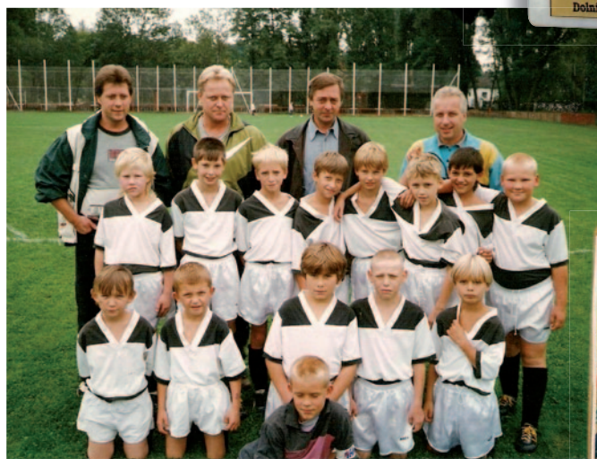
Má trenérská fotbalová historie.