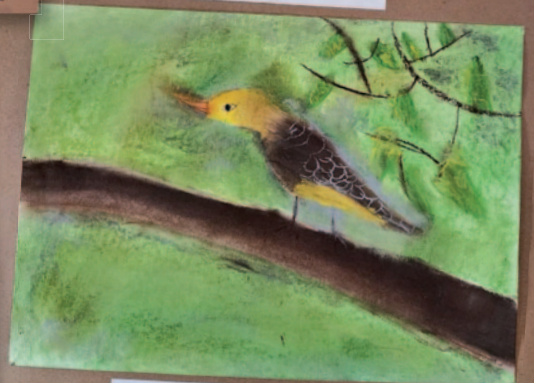
Adéla Kremplová 8 let