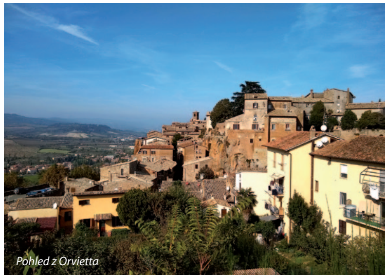
Pohled z Orvietta