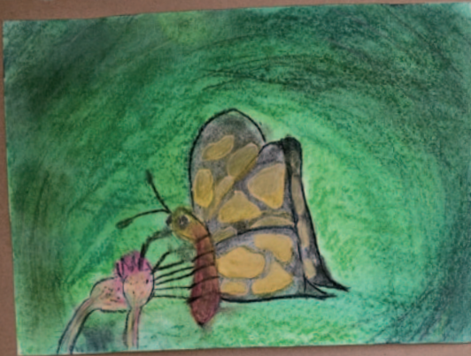
Luci Gottwaldová 9 let