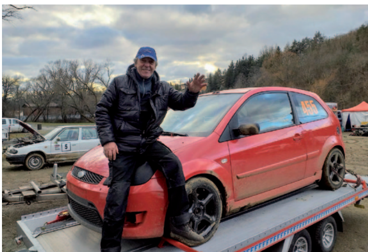
Momentka po závodu.