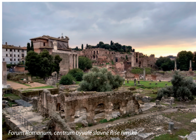
Forum Romanum, centrum bývalé slavné Říše římské

Ve čtvrtek jedeme naším busem na výlet do Tivoli, ale až po mši v podzemí sv. Petra. Ujímám se ke spokojenosti ministrantů role fotografa. Ven procházíme kolem krypty Benedikta XVI., jehož knihu Úvod do křesťanství mám stále na stole. Ten by pohanický obřad Pachamami – bohyně Země ve vatikánských zahradách a nesení její sošky kardinály do basiliky sv. Petra určitě nepovolil. Proč až do konce života stále nosil roucho v papežské bílé barvě a okolnosti jeho rezignace pořád vyvolávají otázky? Autobus směřuje do Tivoli, a mjíme E.U.R., Musoliniho město, které diktátor nechal postavit. Mnozí římsí diktátoři byli také cvoci a dnes pozůstatky jejich stavebnictví obdivují miliony návštěvníků. Zastavili jsme se ve velkolepé bazilice sv. Pavla za hradbami a v Tivoli lenošíme v zahradách vily De Este s výhledy do okolí. Večer konečně zase společná večeře a posezení.