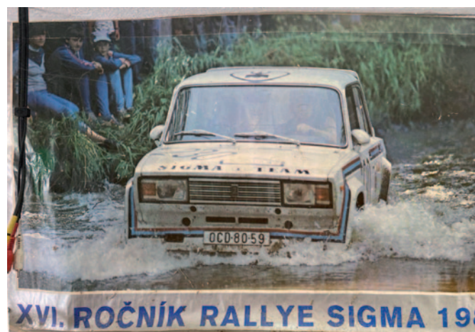
Dřevní doby – tak trochu jiná technika.