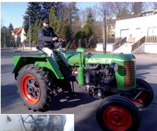
Traktor Zetor 25A, před opravou a po opravě.