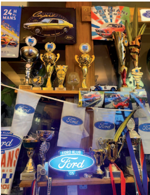
Hnízdo Ford klubu C15.