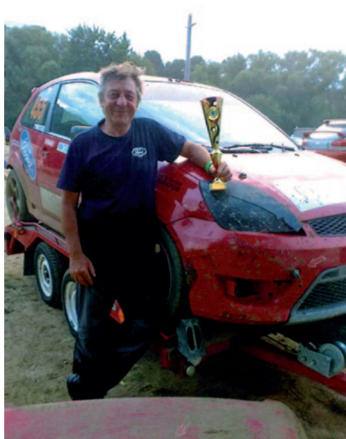
Úspěch vždy vyvolá úsměv na tváři.

jedou tři kvalifikační rozjíždky (4 kola), finále se pak jede na 5 kol, mezi nimiž je i „Joker Lap“, tzv. žolíkové kolo, které závod ztraktivní díky nepředvídatelné výměně vozů na trati. Závodů se běžně účastní 100–120 aut a při pěkném počasí také 3–5 tisíc diváků. Kromě pořadatelů a rozhodčích jsou přítomni hasiči a záchranáři se sanitkou. V horkých letních dnech se trať musí průběžně kropit kvůli prašnosti.