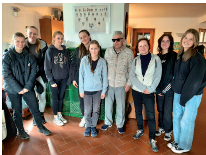
Jezecká škola na návštěvě v naší Oáze.