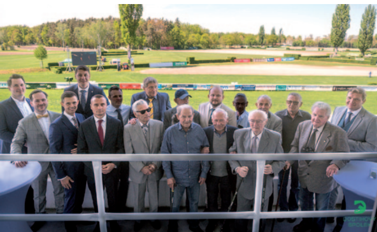
Foto ze setkání vítězů Velké pardubické.