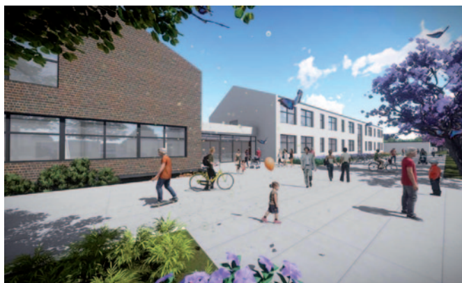
Vizualizace nové školy.