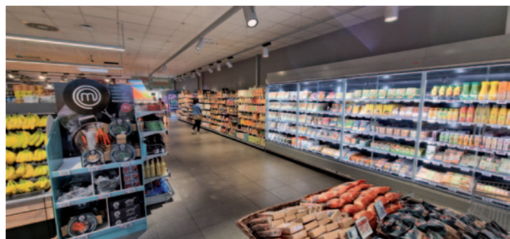
Na výběr mají zákazníci ze širokého sortimentu až 7000 položek.