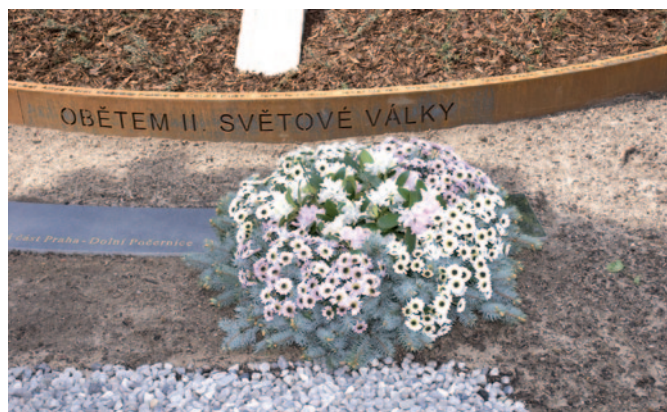
Pomník obětem II. světové války v Dolních Počernicích, autor realizace: Daniel Paul, rok vzniku 2010.