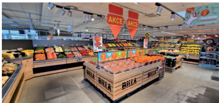
BILLA v Dolních Počernicích nabízí rozšířenou sekci čerstvého ovoce a zeleniny.