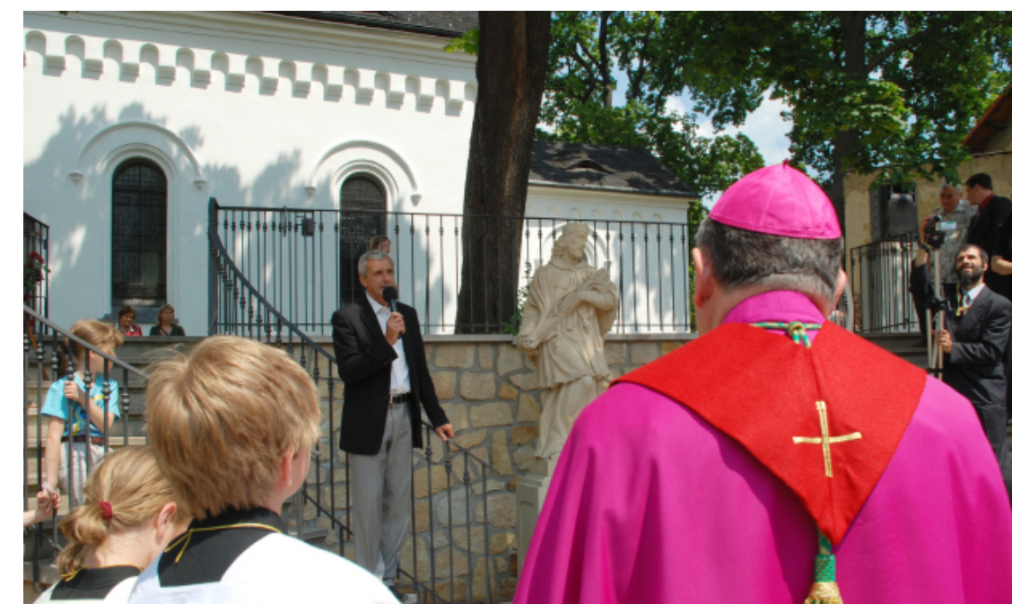
Slavnostní odhalení sochy za přítomnosti Dominika Duky