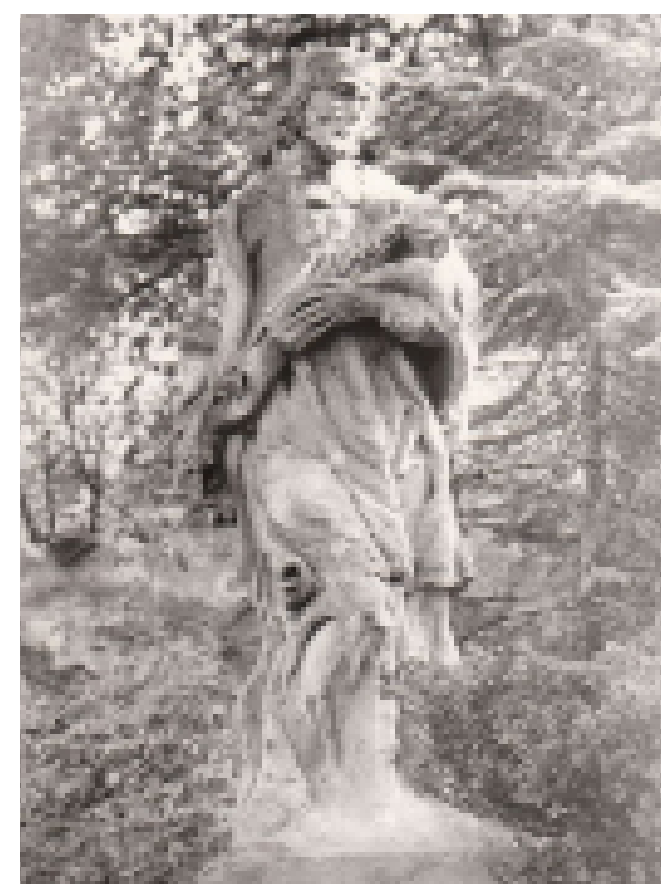
Socha sv. Jana Nepomuckého, 70. léta

Byla pořízena kopie sochy původní, kterou zhotovila společnost Kamenosochařství & restaurátorství Bohumil Pánek a byla instalována na nádvoří bývalého pivovaru. Významnou událostí při slavnostním odhalení sochy, byla přítomnost kardinála římskokatolické církve Dominika Duky, který přijal pozvání a po svém projevu novou sochu také vysvětil.