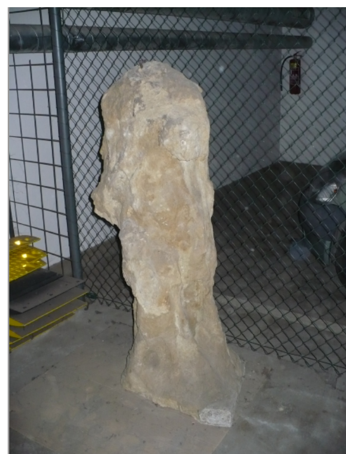
Původní socha byla značně poničena