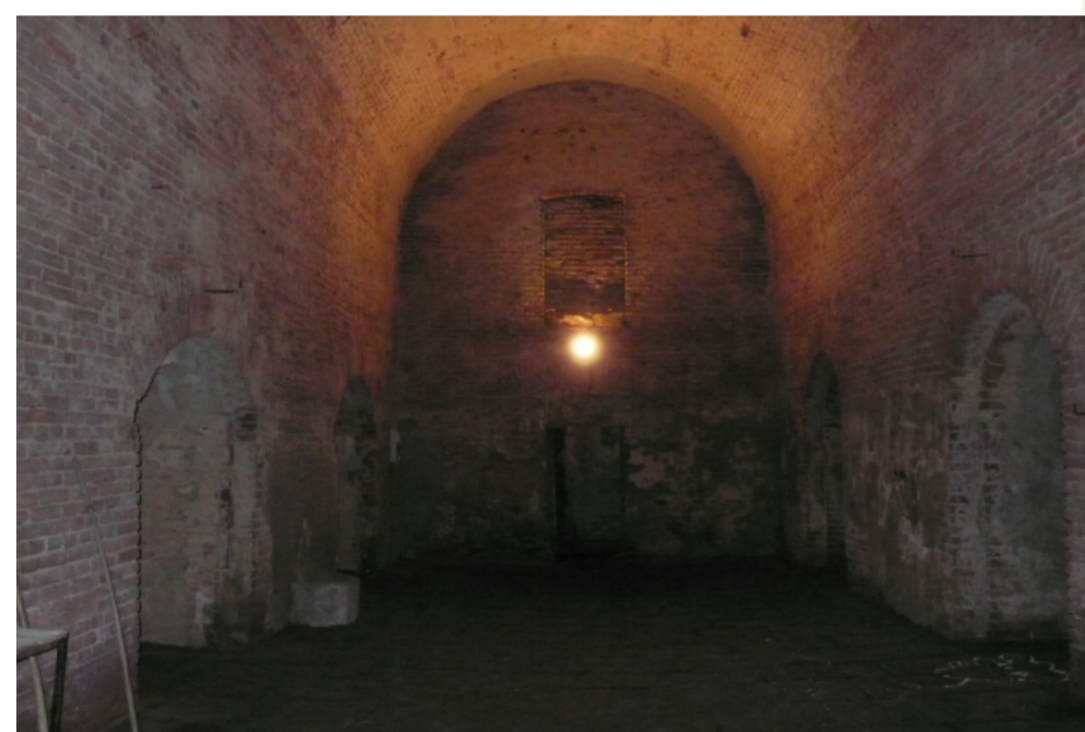
Sklepní prostory pivovaru

Rekonstruovaný bývalý pivovar byl uveden do provozu 23. 6. 2007. V letech 2014–2017 se podařilo ve spolupráci s nájemcem Počernický pivovar (PDDP s.r.o.) velmi citlivě rekonstruovat další objekty a prostory, které dnes slouží jako minipivovar s restaurací a venkovní zahrádkou. V traktu nad ledovými sklepy bylo vybudováno nové fitness centrum při zachování původních působivých stavebních prvků. Všechny budovy a nádvoří bývalého pivovaru čp. 3 a mlýna čp. 2 jsou součástí kulturní památky zámek čp.1, a těší se velké pozornosti a oblibě obyvatel Dolních Počernic a jejich návštěvníků.