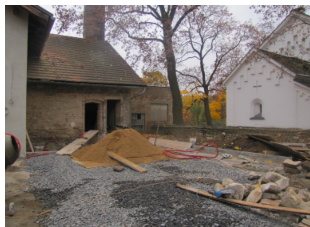
Nádvoří pivovaru během rekonstrukce