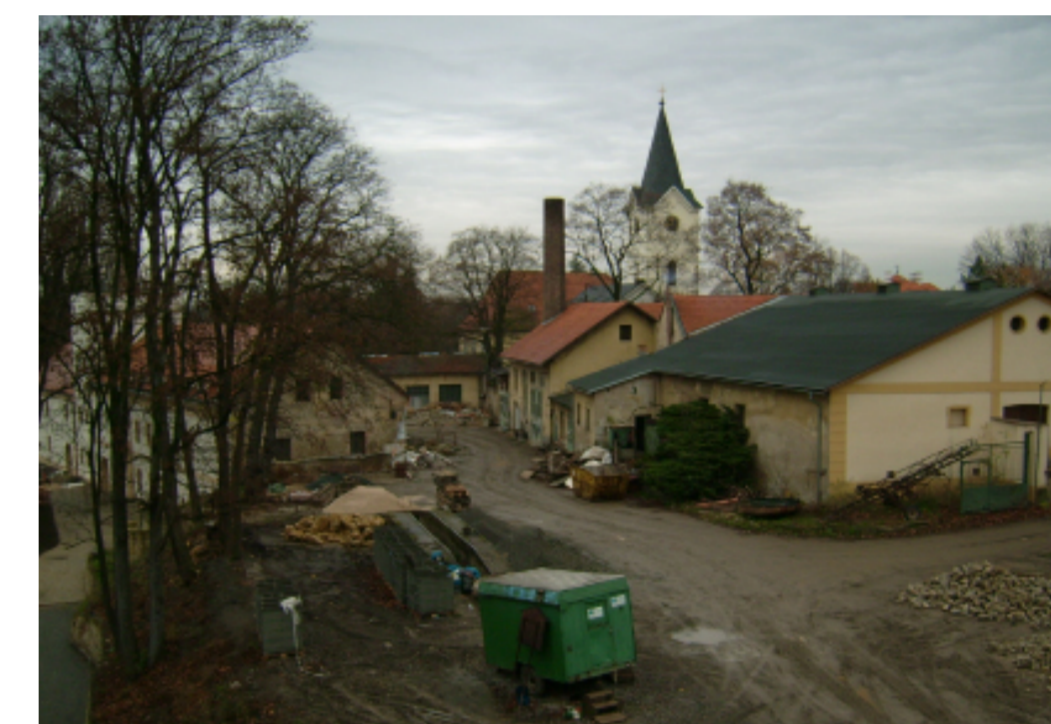
Nádvoří pivovaru před rekonstrukcí