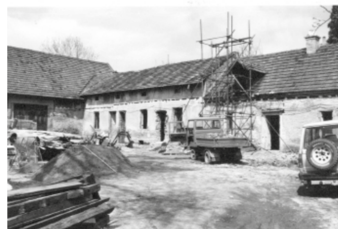
Český statek, před rekonstrukcí