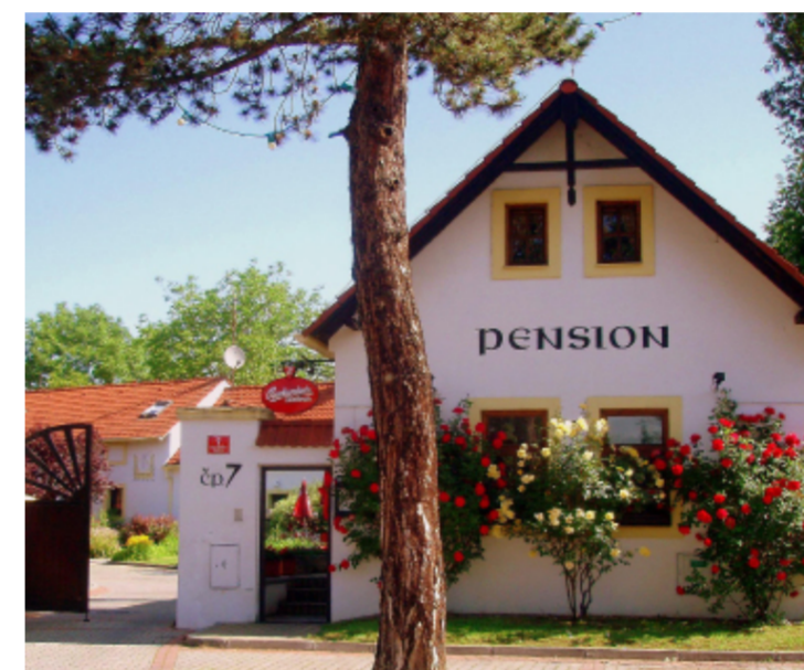
Pension Český statek