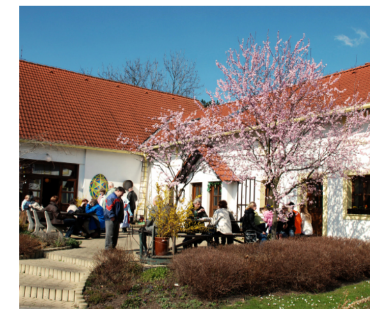
Pension Český statek během Velikonoc