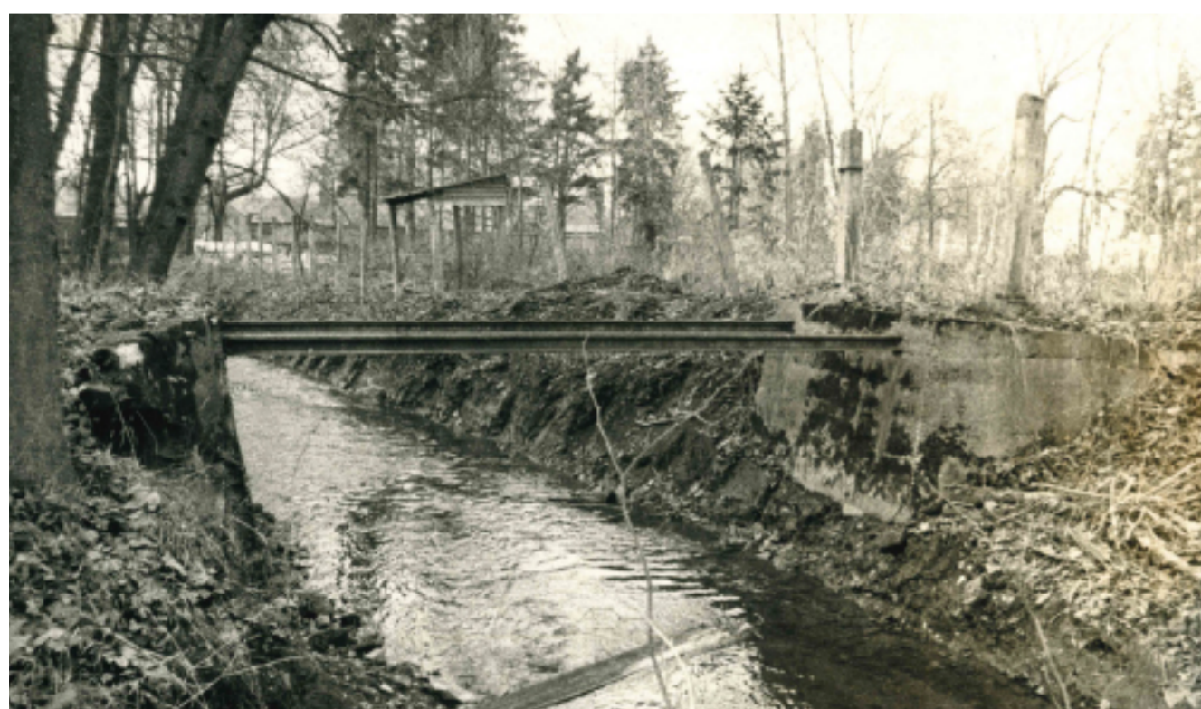
Původní mostky před rekonstrukcí