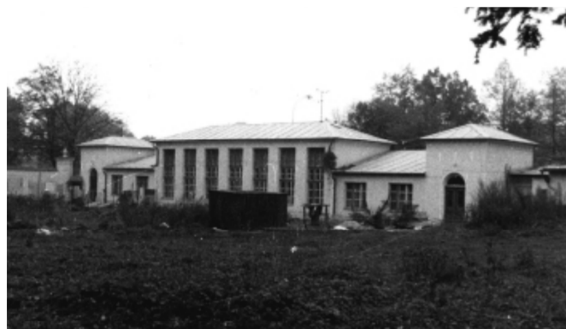
Areál zámeckého parku před rehabilitací