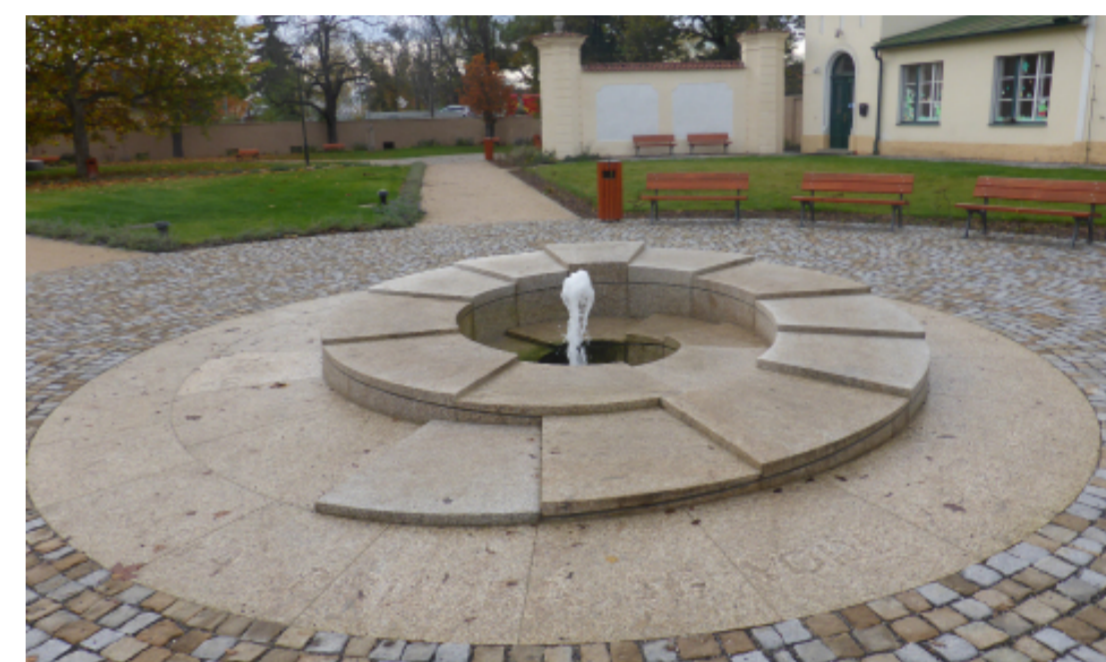
Nově zbudovaná fontána