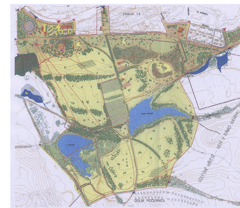
Park U Čeňku, situační plán