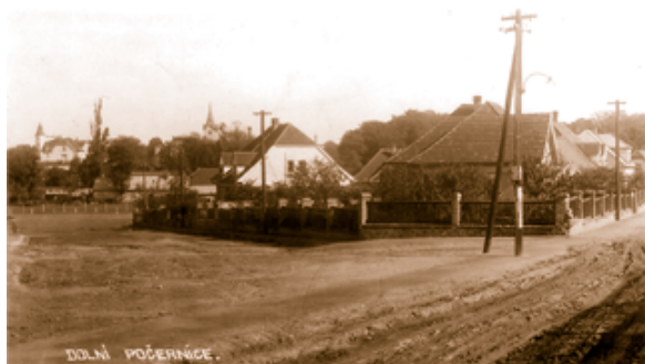
Pohled z ulice Novozámecké do „dolníku“, 30. léta 20. století. V pozadí vidíme most přes Rokytku, Jadran i věž kostela.

I když péče o hřiště nebyla kvůli podmáčenému terénu jednoduchá, dnes se tu nacházejí dvě kvalitní travnatá hřiště, jedno i s automatickým zavlažováním, a další tréninková hřiště. K pohodlí hráčů přispívá i noční osvětlení jednoho hřiště a loni opravené šatny a sprchy.