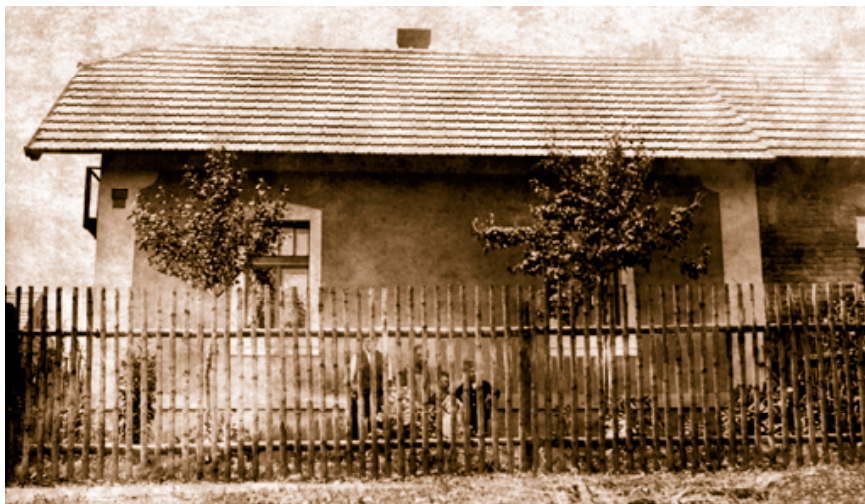
Dvojdoměk z ulice V Ráji. Za zapůjčení fotografie děkujeme paní Radce Štromajerové

Ke čtvrti neodmyslitelně patří dolnopočernická sportoviště, zejména fotbalové hřiště. První škvárové fotbalové hřiště oplocené prkennou ohradou, tak typické pro pražská předměstí, zde vybudoval ve třicátých letech na pozemku pronajatém od obce pražské Dolnopočernický SK.