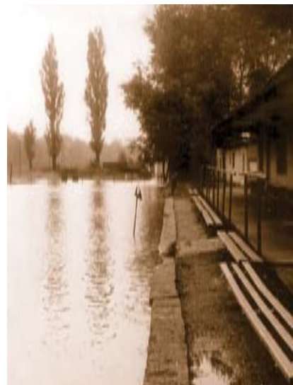
Fotografie z přelomu 70. a 80. let 20. století – rozlíti Rokytky na fotbalovém hřišti.