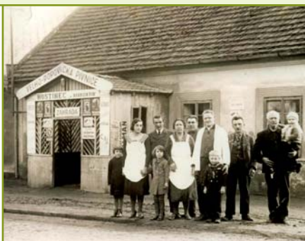
Hostinec „Radhuských“, č.p. 34, s tanečním a divadelním sálem