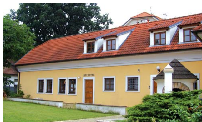
Místní knihovna, exteriér a interiér