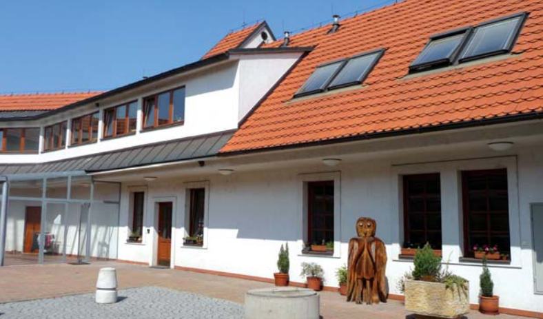
Bytový dům, čp. 10