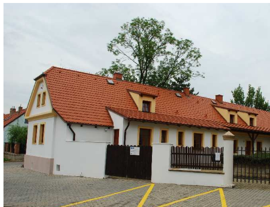
Informační centrum po rekonstrukci