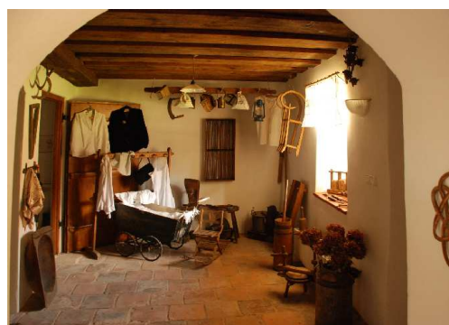
Stálá expozice muzea při IC