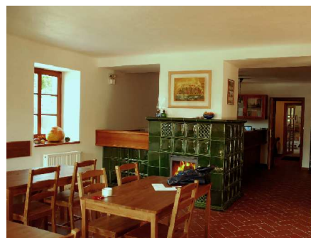
Vnitřní prostor Informačního centra