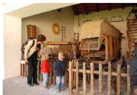
Zemědělské exponáty muzea při IC