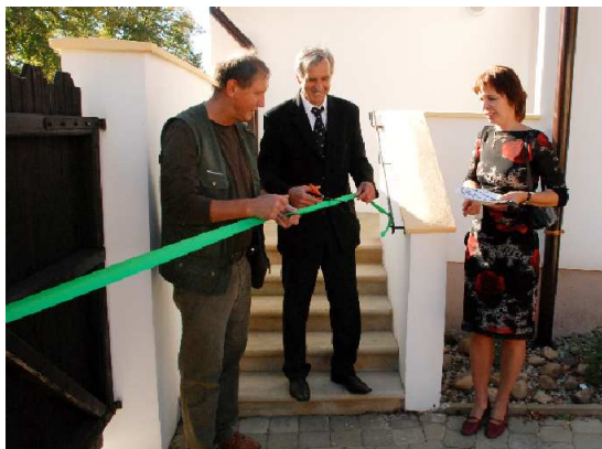
Slavnostní přestřižení pásky