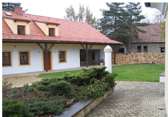
Nádvoří IC po rekonstrukci