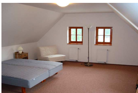
Apartmenty v podkroví IC