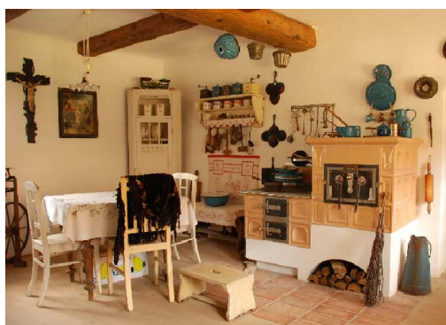
Stálá expozice muzea při IC