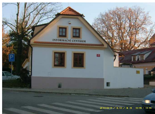
IC s nově upraveným okolím