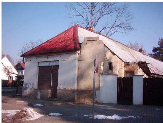
Objekt IC před rekonstrukcí

Tento projekt „Regionálního informačního centra v Dolních Počernicích s veřejně přístupným internetem“ vznikl za finanční podpory EU, MMR ČR, MHMP a MČ Praha Dolní Počernice