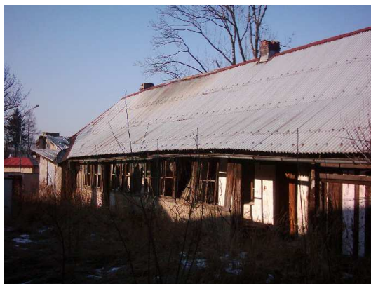
Objekt IC před rekonstrukcí